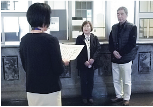
小高館長から認定証と記念品を贈呈

▼「一五〇」年、「一五一」周年と続き、去る二〇一八年十月十六日には当資料館開館以来「一五〇」万人目のお客様をお迎えすることができました。