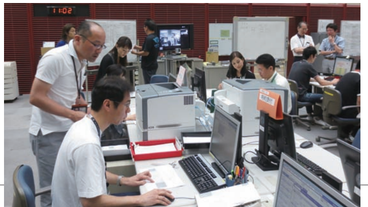
休日に実施された日銀ネットの災害対策訓練の様

取材を終え、御堂筋から旧館を振り返った時、取材前に見た明治時代の建物は、周囲の現代的な建物と調和し、それらの重しとして落ち着きを与えていることに気付きました。