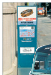
八重洲、京橋、日本橋地区を結ぶ無料巡回バス「メトロリンク日本橋」

若返った感がある。今、この通りでは三井本館街区再開発計画が進められている。都の「重要文化財特別型特定街区制度」の初適用を受け、重要文化財「三井本館」を保存しながら、「日本橋三井タワー」の建設を行うというもの。地上三九階という超高層ながら、景観との違和を生じないよう設計上の配慮が凝らされている。高層部には、世界的なラグジュアリーホテル「マンダリン オリエンタル 東京」の入居が決定。海外のビジネスマンや観光客らが、この地で日本の近世、近代、現代の交錯を楽しむシーンが見られるのももななくだ。