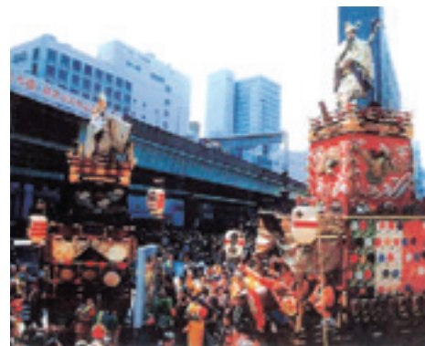
華やかに賑やかに……日本橋創業四百年を記念したイベント（平成15年3月）。数々の山車や神輿など約4000人の出場者がパレードした。