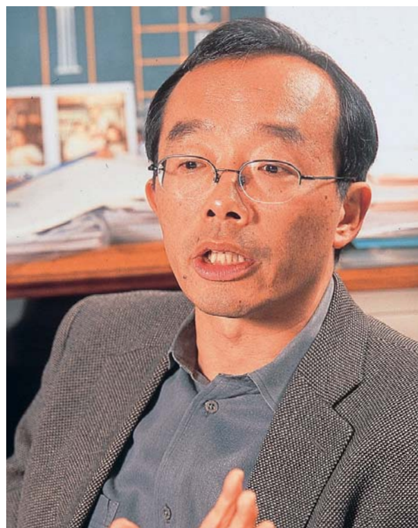
東京都杉並区立和田中学校校長