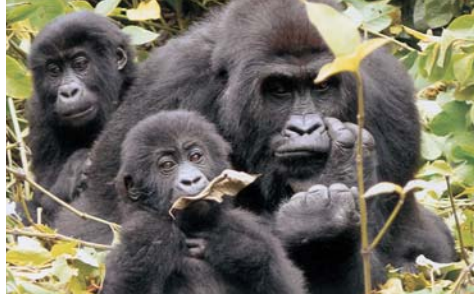
双子のゴリラとお母さんゴリラ。人間と同じようにゴリラの顔はそれぞれ違う。鼻についた模様などで個体を認識できる。