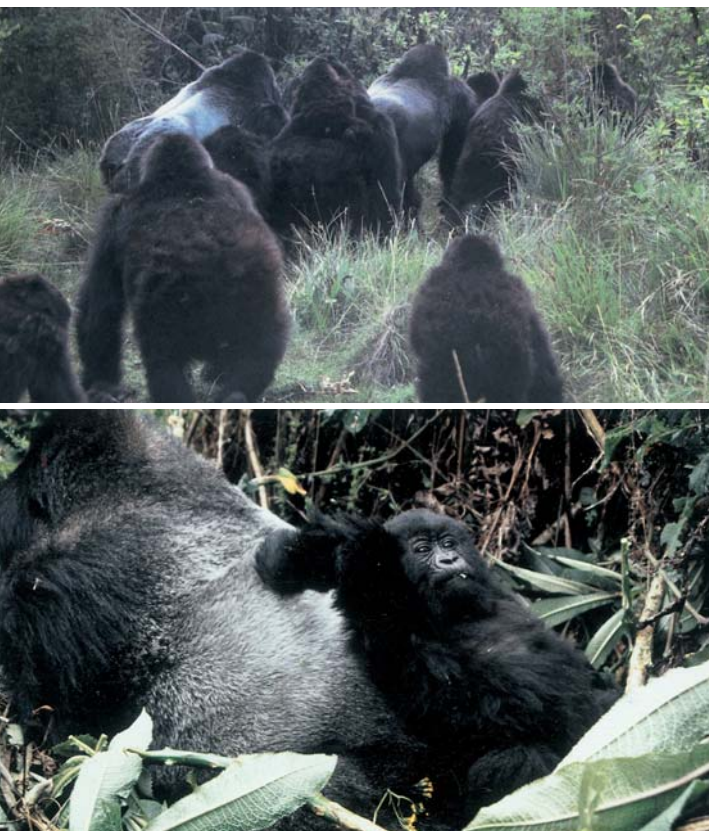
成長したオスゴリラは、背中が雪のように白くなるためシルバーバックと呼ばれる。1頭のシルバーバックを中心に、複数のメスとその子供たちで群れをつくって暮らしている(上)。シルバーバックの背中をすべり台にして遊ぶ子供ゴリラ。お父さんゴリラは子供たちの面倒を非常によく見る(下)。

山極 以前作家の重松清さんと対談したときも、同じようなことをおっしゃっていました。都市の二