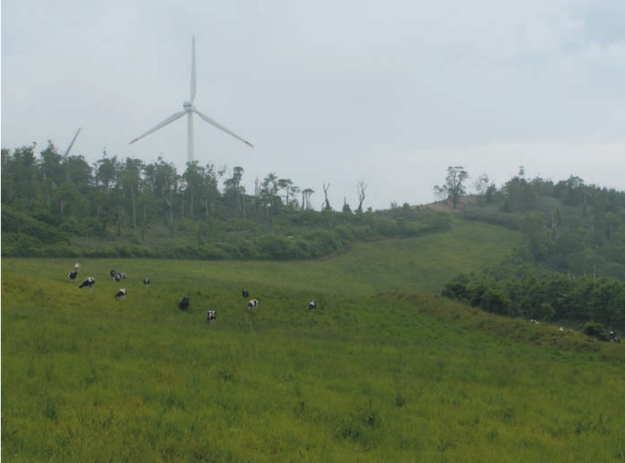
葛巻町でのクリーンエネルギーの導入は風力発電から始まった。標高1,000m級の牧場に建てられた風車は、羽と支柱を合わせると93m。近くで見ると圧倒的な大きさに感動すら覚える。