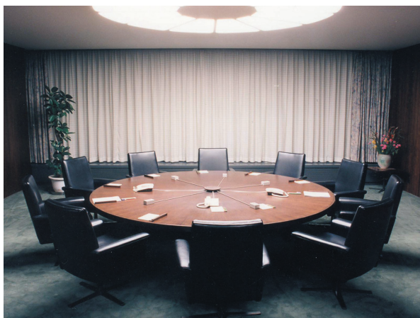
政策委員会会議室