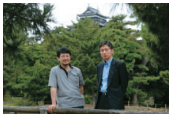
背後に松江城を仰いで。緑の豊かさに心が和む。

見て、技術で経済的な成功を収めたというロールモデルが身近になんというの、それはそれでよくないと思うのです。僕自身、プログラマーのまま、マネージャーや経営者の立場に進まなくても社会的に成功できるんだ、オープンソースをやっているのも食い詰めなくて済むんだということを示したいと思っています。正直、ちょっと恥ずかしいところはあるんですけど、日本のこれまでの発展を支え、世界に発信してきたのは技術系の人間の力に負うところが大きいはずなのに、何かの統計で文系