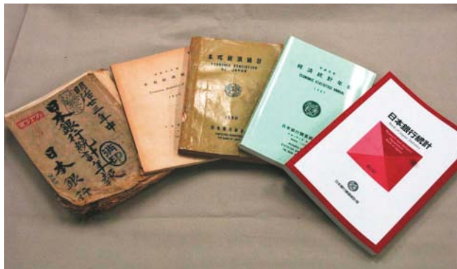
写真2 / 明治、大正、昭和、平成と続く統計書。右端は、現在発行している統計書の最新刊。120年の歴史を経て現代風にスマートに？

データ検索サイト」を始めました。これは、自分が探したいデータを「キーワード」や「メニューの選択」で選び、必要なデータのみをダウンロードするものです。日本銀行が作成する統計データのほぼすべてが収録されており、手に入れた統計を過去にさかのぼって入手