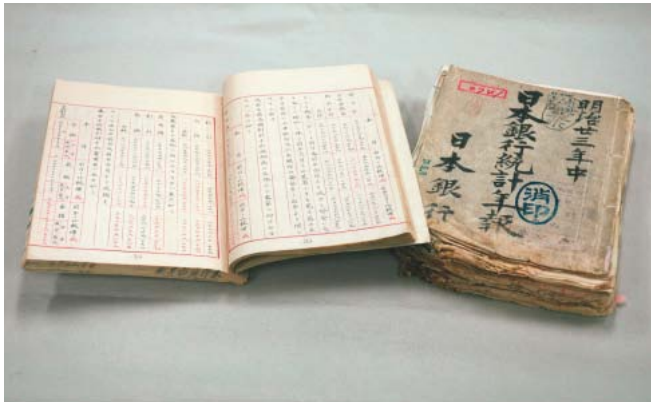
写真1 / 明治時代に、実際に刊行された『日本銀行統計年報』(1890年刊)。このころ日本で電話創業。近代国家の夜明けを感じる。

データ検索サイト」を始めました。これは、自分が探したいデータを「キーワード」や「メニューの選択」で選び、必要なデータのみをダウンロードするものです。日本銀行が作成する統計データのほぼすべてが収録されており、手に入れた統計を過去にさかのぼって入手