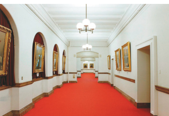
本館の廊下には初代から第26代までの総裁の肖像画がある

ここは、本館地下一階の旧地下金庫です。約六年前まで、一〇〇年以上の間実際に使われ