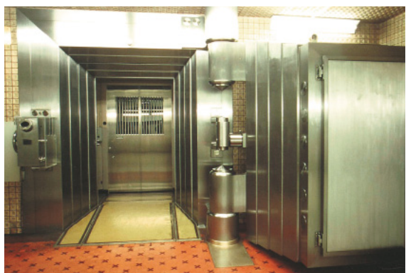
関東大震災をも耐え抜いた旧地下金庫

ていました。この扉の厚さは九〇センチ、重さは扉と外枠を合わせて二五トンあります。