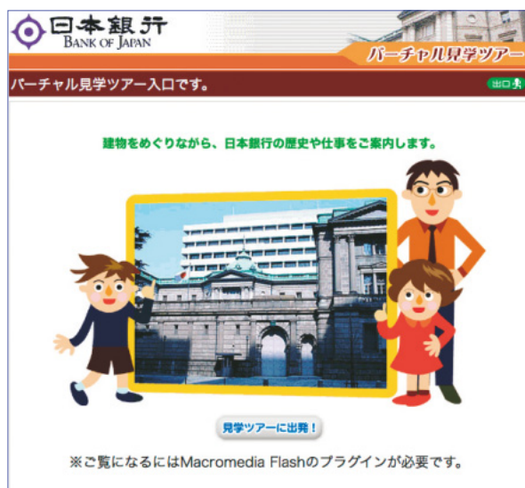
バーチャル見学ツアー