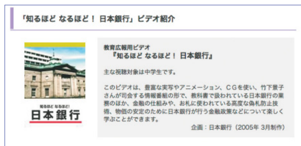
「知るほど なるほど！ 日本銀行」ビデオ紹介