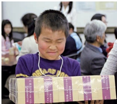
1億円の重さを体験

▼日本銀行本店では、四月一日（火）、三日（木）の二日間にわたり、小学校四～六年生および中学生のお子さまとその保護者の方を対象に、「日銀春休み親子見学会二〇一四」（協力：金融広報中央委員会）を開催しました。