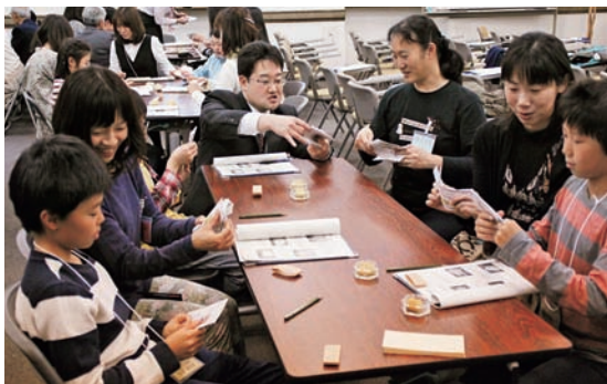
親子で参加「お札の数え方」体験