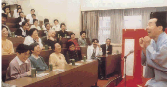
林家木久蔵師匠の落語に笑いが絶えない実験風景。この後の検査データに明らかな笑いの効用が表れた（写真：吉野槇一氏著『脳内リセット』より）