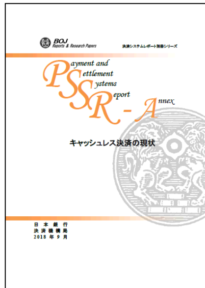
「キャッシュレス決済の現状」 (決済システムレポート別冊シリーズ) 2018年9月公表